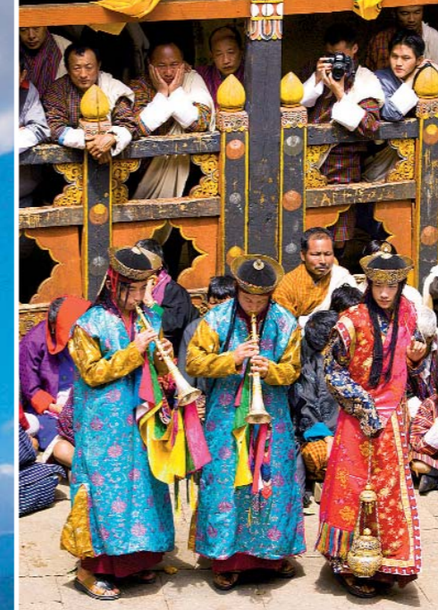
KULTURELLE HÖHEPUNKTE des buddhistischen Lebens sind die religiösen Feste. Unbedingt besuchen!