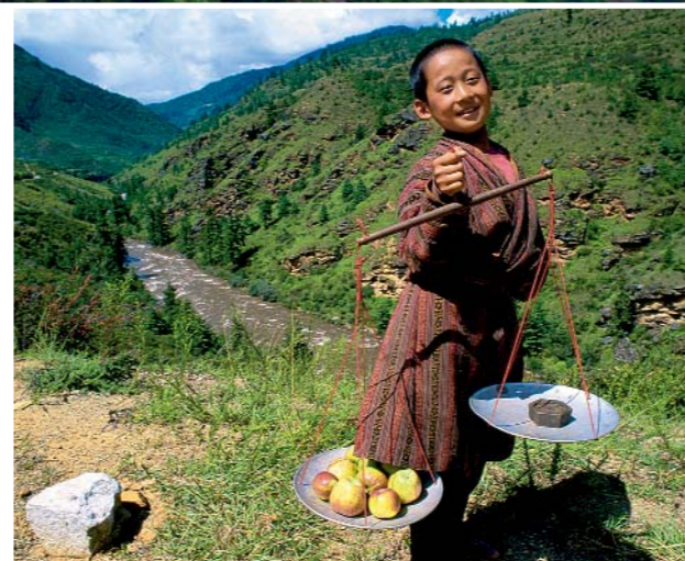
NATIONALTRACHT ist für Bhutaner Ehrensache. Gho heisst das Gewand, das auch dieser Äpfel verkaufende Bub trägt.

angesagt, werden zu Fuss oder mit Bus besichtigt. → Die Dzongs , herrschaftliche, jahrhundertalte Klosterburgen sind charakteristisch für Bhutan. Sie sind Zentrum des religiösen und staatlichen Lebens . Nicht alle Gebäude können aber besichtigt werden. Denn dass Bhutan von Feriengästen nicht überschwemmt wird, dafür ist gesorgt. So reisen pro Jahr nicht mehr als 7000 Touristen ein. Eine touristische Infrastruktur entsteht trotzdem. → Auf Luxus müssen Touristen in Bhutan also nicht mehr verzichten. Wie z. B. im Hotel Amankora ( www.amanresorts.com ) der Aman-Kette. Es liegt in einem Pinienwald, ca. 20 Minuten von Bhutans Flughafen Paro entfernt. Die