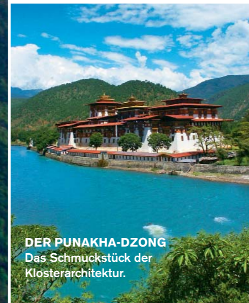
DER PUNAKHA-DZONG Das Schmückstück der Klosterarchitektur.

24 Suiten und das Spa lassen keine Design-Wünsche offen. Ebenfalls sehr luxuriös: das «Uma Resort» in Paro ( www.uma.como.bz ). Das Hotel mit 26 Zimmern und Suiten liegt auf einem Bergrücken und bietet eine fantastische Aussicht auf Paro. → Bhutaner liebens kulinarisch scharf : Hauptnahrungsmittel sind Gemüse, Käse, Huhn, Schweine-, Schaffleisch und natürlich Reis. Angerichtet wird gerne im Buffet-Stil. Und mit viel Chili! Die Schoten werden meist noch zusätzlich gereicht! Auf die Zigarre danach muss allerdings verzichtet werden. Denn Rauchen ist in Bhutan aus religiösen und gesundheitlichen Gründen in der Öffentlichkeit, in Restaurants, Clubs und Hotels verboten.