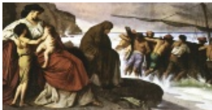
Medea auf der Flucht von Anselm Feuerbach, 1870 (München, Neue Pinakothek).

Wer schöpferisch auftanken und nicht nur faulenzten will, verbringt seine Ferien nicht nur aktiv, sondern auch kreativ. Künstlerische Ferientage – möglichst in ungewohnter Umgebung – sind eine seelische und schöpferische Bereicherung. Baumeler Reisen organisiert im Rahmen seiner bunten, breitgefächerten Palette von Wanderreisen schon seit einem Vierteljahrhundert Malferien in alle Welt, die von ausgewiesenen Künstlern begleitet werden. Neben Aquarellieren und Skizzieren gehören auch das Erleben Natur und das Staunen, die Erholung und die Gastronomie zu diesen Reisen. Der Maler Anselm Feuerbach (1829-80) sagte einmal, um ein guter Maler zu sein brauche es vier Dinge: ein weiches Herz, ein sensibles Auge, eine leichte Hand und frisch gewaschene Pinsel. Feuerbachs Kunst fand in seinen von melancholisch-heroischer Stimmung geprägten monumentalen Gemälden ihre endgültige Form.