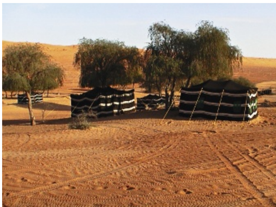
Das omanische Camp in der Wahiba Sands Wüste.

Holiday Maker Tours Uraniastrasse 34, 8023 Zürich Tel. 044 215 30 80, Fax 044 215 30 81 holiday@holiday-maker.ch www.holidaymaker.ch