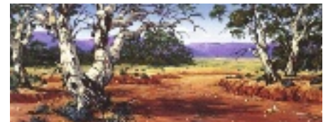
Die Natur begleitet den Landschaftsmaler.

Für Malferien ist Feuerbachs Hinweis auf die «leichte Hand» von Bedeutung. Das Loslassen und eingehende Beobachten sind wichtige Voraussetzungen für das Malen von Landschaften, Menschen, Häusern, Pflanzen und Tieren. Der hingebungsvolle Maler lässt die Welt um sich herum versinken bis sich das Glücksgefühl in einer Art Halbtrance einstellt. Erst dieser Zustand ermöglicht es, die Dinge in ihrer Plastizität, ihrer Schattierung und ihren Farbtönen wahrzunehmen. Der Maler malt mit dem Auge. Seine Kunst ist die Kunst, regelmässig und schön zu sehen. Die Aussage, dass der Landschaftsmaler die Natur begleite, trifft nicht für alle zu. Viele nehmen es gerade umgekehrt wahr, nämlich dass die Natur den Künstler begleitet.