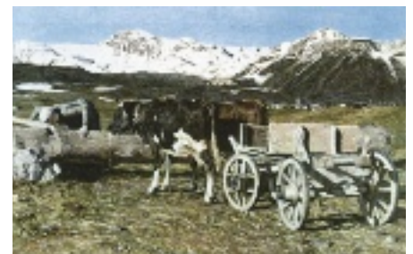
An der Tränke von Giovanni Segantini, 1888.

Albrecht Dürers (1471-1528) Landschaftsaquarelle sind die ersten bekannten in sich geschlossenen Darstellungen der Natur des 15. und 16. Jahrhunderts. Dürer behauptete, ein guter Maler sei nur, wer inwendig «voller Figur» sei. Einen Schritt weiter ging der Italiener Giovanni Segantini (1858-99). In seinen Werken, die das Hochgebirge rund um Savognin und des Engadins mit seinen